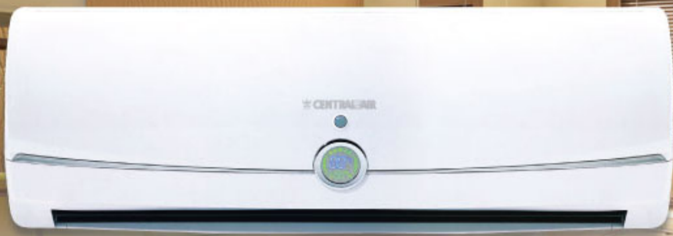
Model : CFW-GA 09,12,18 ;