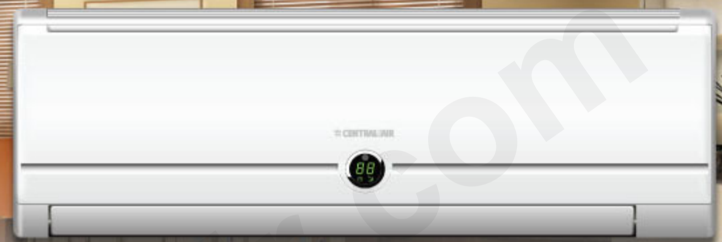
Model : CFW-GA 24 ;